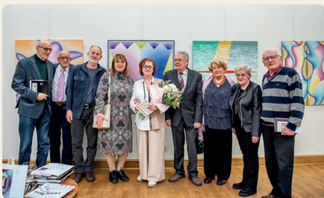
Wernisaż malarski D. Kurczewicz w Lublinie