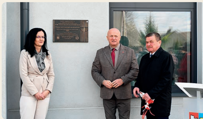
Odstąpienie tablicy pamięci zamordowanych pawłowskich Żydów