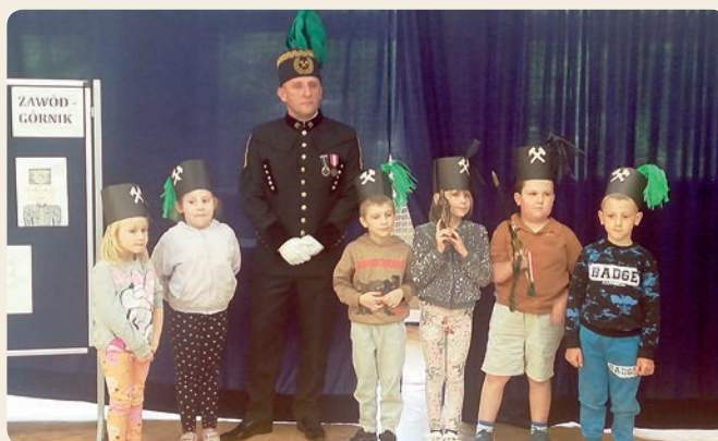
SP w Pawłowie. Spotkanie z górnikiem

Wydanie gazety współfinansowane ze środków Gminy Rejowiec Fabryczny