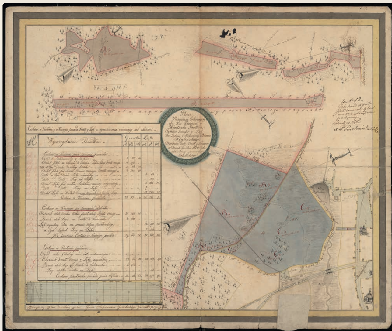
Plan posiadłości cerkiewnych we wsi Krasne i w miasteczku Pawłowie (1834), źródło: Archiwum Państwowe w Lublinie. Zbiór planów różnych urzędów (zespół 636), sygn. 89.