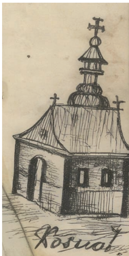
Il. 1. Plan z 1834 r., fragment z kościołem.

Plan posiada nieprzeciętną wartość kartograficzną, opartą na szczegółowym pokazaniu elementów przestrzennych, takich jak: kościoł, cerkiew, austria na rynku, domy usytuowane wzdłuż głównych ulic (z rozróżnieniem na ustawione kalenicowo, czyli równoległe do ulicy oraz szczytowo, czyli prostopadle), zabudowania folwarczne z dworem i młynem przy stawie, mosty na ciekach wodnych, kapliczki i krzyże, cmentarz oraz tereny zadrzewione i łąki. Część rysunkową uzupełniają rozbudowane