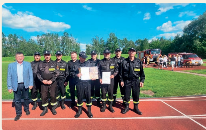
OSP Pawłów. Zawody Sportowo-Pożarnicze w Siedliszczu