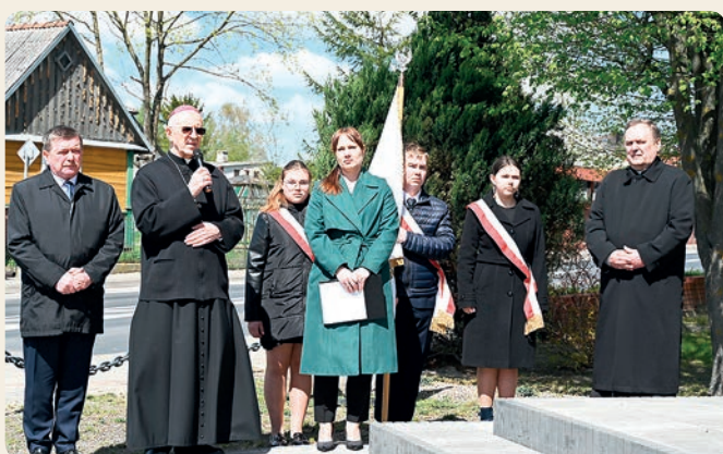
Uroczystości rocznicowe pacyfikacji Pawłowa