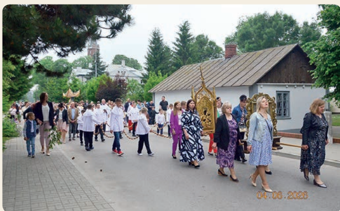
Święto Bożego Ciała 2026 w Pawłowie