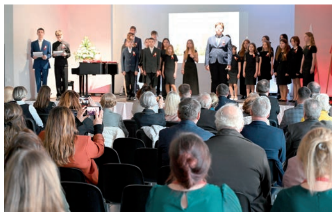
Koncert Pamięci