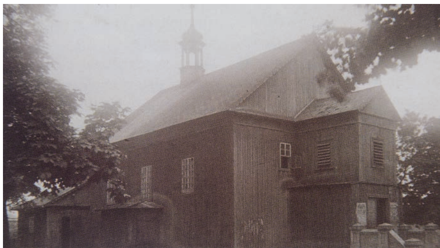
Il. 3. Kościół na Bronowicach w Lublinie (1937 r.).

Cerkiew unicka pw. św. Barbary, uwidoczniła na omawianym planie, wybudowana została w 1720 r. jako drewniana, w miejscu poprzedniej z I poł. XVI w., która uległa zniszczeniu. Początkowo parafia powstała jako prawosławna, po unii brzeskiej w 1596 r. została przekształcona na unicką, a w 1875 r. ponownie stała się prawosławną, co wiązało się ze zmianą wezwania na Wniebowzięcia Najświętszej Marii Panny. Jak wynika z wizytacji przeprowadzonej przez ks. O. Zajkowskiego w 1789 r., była to budowla drewniana, zapewne trójdzielna, z kruchtą, zwieńczona kopułą; cerkiew miała dwój drzwi oraz cztery okna i posiadała dzwonicę; otoczona była parkanem; obok cerkwi znajdowała się dwuizbowa plebania oraz ogrodzony cmentarz 5 . Około 1805 r. przeprowadzono remont świątyni, obejmujący wykonanie szalunku elewacji oraz położenie blachy na kopule; w l. 30. XIX w. ponownie oszalowano budynek i pomalowano kopułę na biało 6 . Poza wyżej wspomnianymi opisami świątyni, brak materiałów ikonograficznych, ukazujących jej wygląd. Poprzez analogie do podobnych budowli sakralnych można założyć, że cerkiew pawłowska była zbliżona wyglądem np. do dawnej cerkwi św. Mikołaja Cudo-