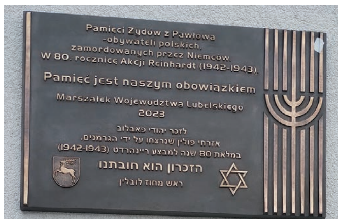
Tablica pamięci pawłowskich Żydów zamordowanych przez Niemców

ły Podstawowej im. Jana Kochanowskiego w Pawłowie.