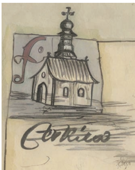
Il. 2. Plan z 1834 r., fragment z cerkwią.

opisy gruntów i ich granic. Plan ma też niewątpliwą wartość artystyczną – odręczne rysunki z cieniowaniem ołówkiem i kolorowymi podmalówkami, dekoracyjne elementy w postaci rozbudowanych strzałek z fantazyjnymi grotami i lotkami, użytymi jako oznaczenia północy i południa, a także centralnie umieszczony wieniec laurowy z zieloną podmalówką, otaczający tytuł planu. I w końcu, co wymaga szczególnego podkreślenia, plan posiada wyjątkową wartość ikonograficzną. Otóż zawiera on rysunki dwóch pawłowskich świątyń – kościoła rzymskokatolickiego (il. 1) i cerkwi unickiej (il. 2), które w przeciwieństwie do pozostałych budynków, przedstawionych na planie w formie uproszczonego rzutu z góry, pokazane są w widokach z boku. I tu nasuwa się pytanie, czy są to faktyczne wizerunki tych świątyń, czy tylko rysunki symboliczne? Zanim spróbujemy odpowiedzieć na powyższe pytanie i odnieść te rysunki do stanu faktycznego, warto przypomnieć historię tych obiektów.