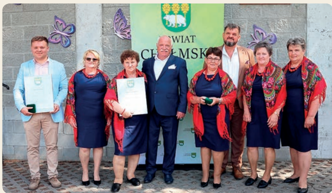
KGW „Krzywowlanki” - Zasłużone dla Powiatu Chełmskiego