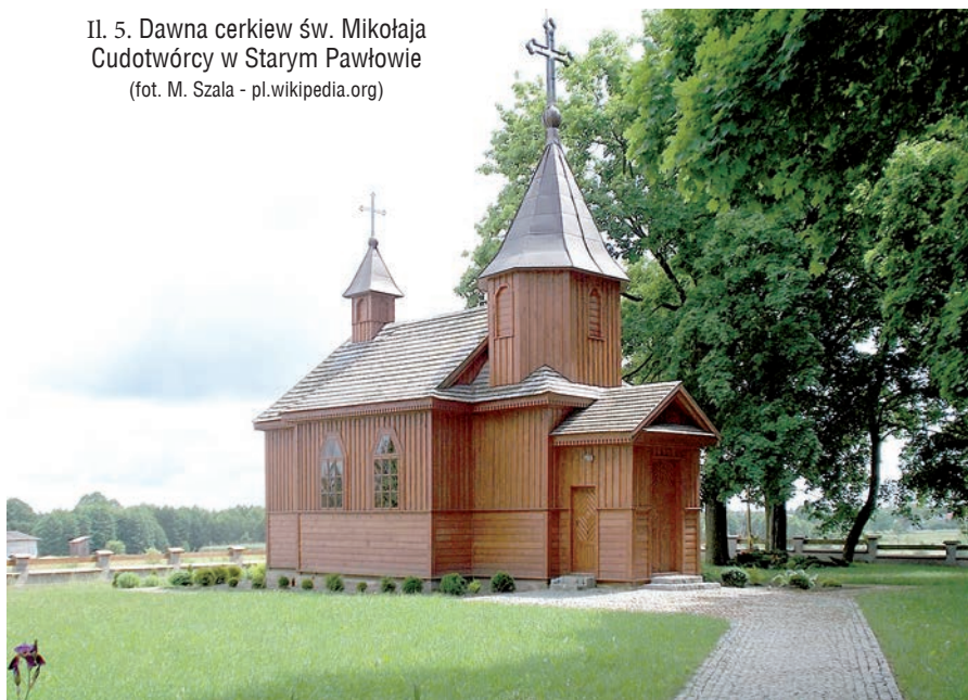
II. 5. Dawna cerkiew św. Mikołaja Cudotwórcy w Starym Pawłowie