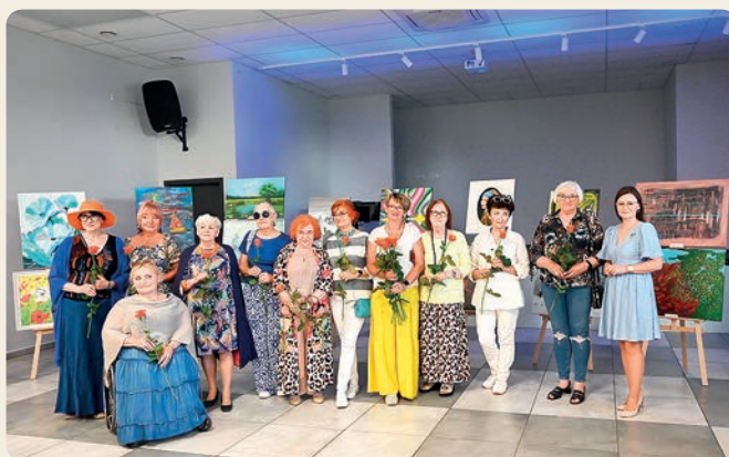
Wernisaż malarski „Pasji” w Pawłowie, fot. GOK