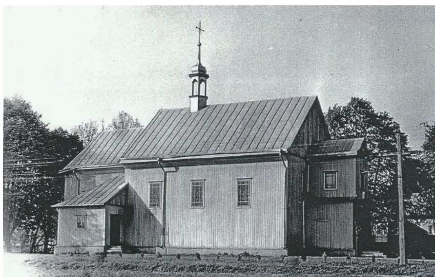
Il. 4. Kościół w Kazimierzówce 1982 r. (do 1912 r. w Pawłowie).

twórcy w Starym Pawłowie, gm. Janów Podlaski (il. 5), która także posiada tylko 4 okna, wbudowaną dzwonicę w formie wieży oraz kruchtę przy wejściu głównym; kopuła wzmiankowana w cerkwi pawłowskiej mogła znajdować się na wieży-dzwonicy 7 .